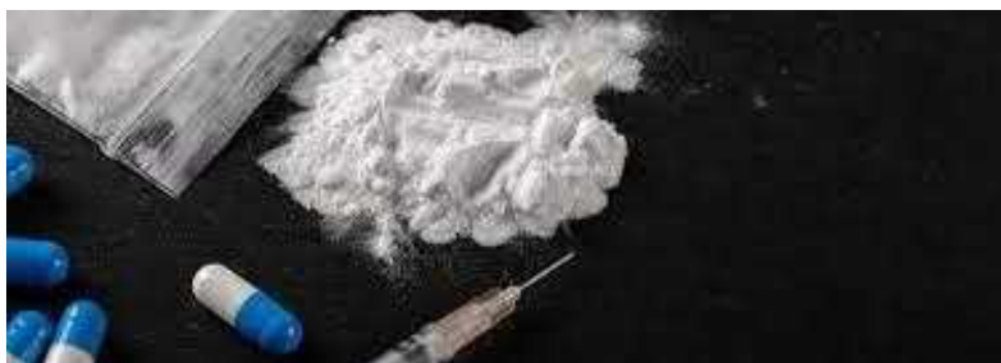
الف) فن‌سیکلیدین