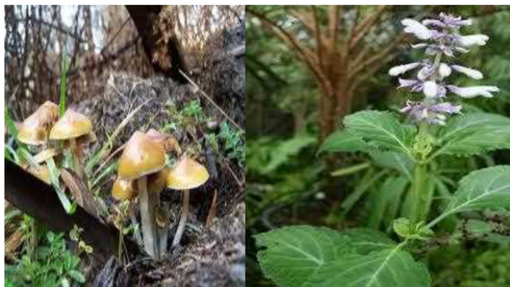
Magic Mushroom (د) Salvia Divinorum (ج)