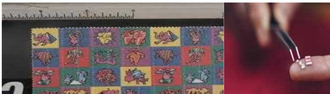
ب) LSD