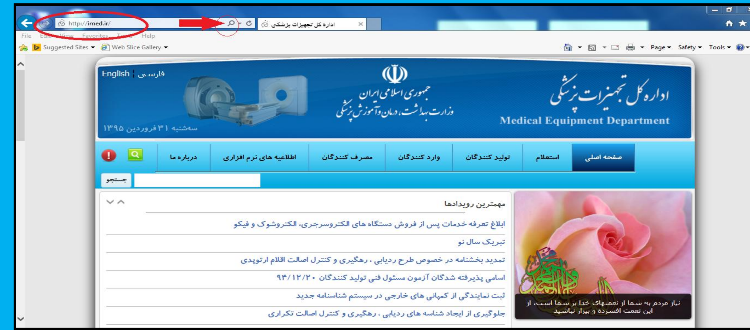
شکل ۱- مراجعه به آدرس اینترنتی سایت