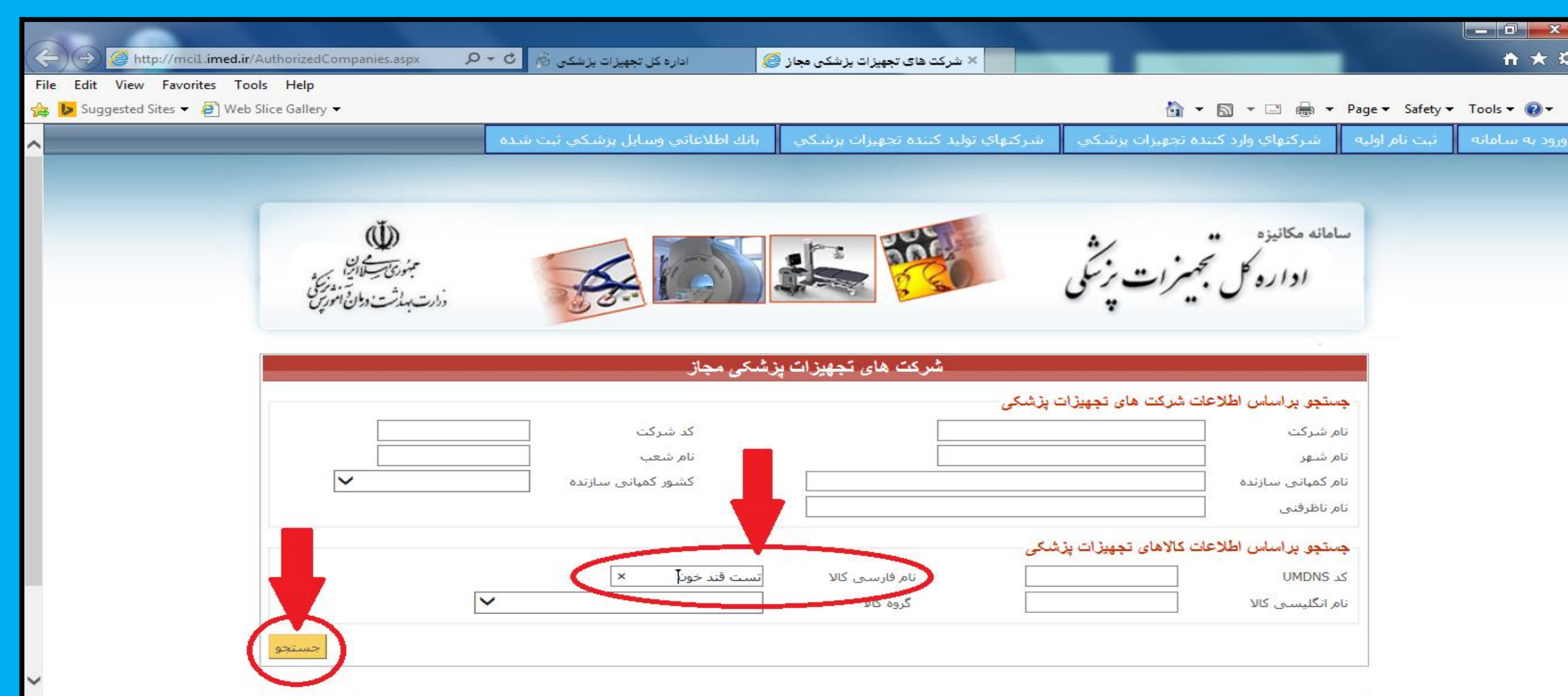
شکل ۴- مرحله چهارم

۴- تایپ عبارت " تست قند خون" در محل مشخص شده برای نام فارسی کالا و انتخاب گزینه جستجو.